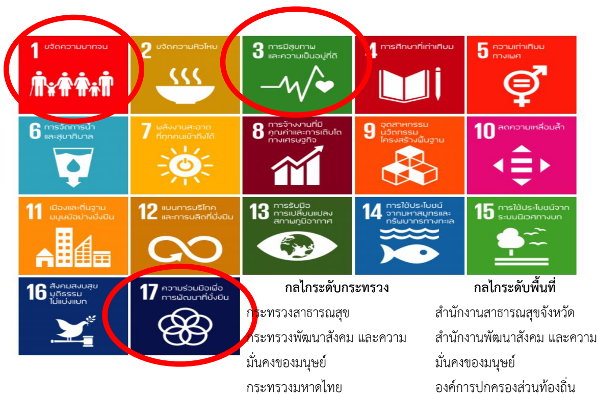
ภาพที่ 2 เป้าหมายการพัฒนาที่ยั่งยืนที่ใช้ในการประเมินผล