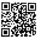
(แบบฟอร์ม)

ข้อบังคับดังกล่าว และเพื่อจัดเก็บเป็นฐานข้อมูลสนับสนุนการจัดสรรงบประมาณในการดำเนินการใกล้เคียงและประណอม ข้อพิพาทของอนุกรรมการหมู่บ้านในอนาคต ดังนั้น เพื่อให้การสำรวจข้อมูลที่แท้จริงของการใกล้เคียงประណอมข้อพิพาท ของคณะกรรมการหมู่บ้านเป็นไปด้วยความเรียบร้อย จึงให้กำนัน ผู้ใหญ่บ้านสำรวจผลการดำเนินการใกล้เคียงประណอมข้อ พิพาทของคณะกรรมการหมู่บ้านตามข้อบังคับกระทรวงมหาดไทย ว่าด้วยการปฏิบัติงานประนีประนอมข้อพิพาทของ คณะกรรมการหมู่บ้านตามแบบพร้อมผ่านทาง QR code และเมื่อดำเนินการแล้วเสร็จรายงานให้อำเภอทราบด้วย