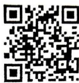
(ช่องทางการรายงาน)

๓.๑.๔. จังหวัดอุบลราชธานี แจ้งให้ทุกอำเภอรายงานข้อมูลการใกล้เคียงตามข้อบังคับกระทรวงมหาดไทยว่าด้วยการปฏิบัติงานประนีประนอมข้อพิพาทของคณะกรรมการหมู่บ้าน พ.ศ. ๒๕๓๐ ตั้งแต่วันที่ ๑ ธันวาคม ๒๕๖๖ จนถึงวันที่ ๒๕ มกราคม ๒๕๖๗ ผ่านทาง QR code ภายในวันที่ ๒๖ มกราคม ๒๕๖๗ นั้น กรมการปกครองแจ้งเพิ่มเติมว่า เพื่อให้เป็นฐานข้อมูลสำหรับการพัฒนาแก้ไขปรับปรุง