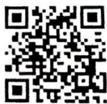
(ช่องทางรายงาน)

๓.๑.๕. ด้วยกรมการปกครองแจ้งว่า กระทรวงมหาดไทย ได้มีหนังสือ ที่ มท ๐๓๑๐.๒/ว ๒๔๑๐ ลงวันที่ ๔ สิงหาคม ๒๕๕๑ เรื่อง แนวทางปฏิบัติเกี่ยวกับการดำเนินการทางวินัย การอุทธรณ์ และการร้องทุกข์ ของกำนัน ผู้ใหญ่บ้าน แจ้งให้จังหวัดทราบว่าในส่วนของวินัยและโทษทางวินัย ตามพระราชบัญญัติระเบียบข้าราชการพลเรือน พ.ศ ๒๕๓๕ ยังคงใช้ กับกำนัน ผู้ใหญ่บ้าน ฯลฯ ต่อไปได้ ตามนัยมาตรา ๖๑ ทวิ แห่งพระราชบัญญัติลักษณะปกครองท้องที่พุทธศักราช ๒๔๕๗ ที่กำหนดให้ใช้กฎหมายว่าด้วยระเบียบข้าราชการพลเรือนโดยอนุโลม และการดำเนินอุทธรณ์และการร้องทุกข์ ที่เกี่ยวกับ กำนัน ผู้ใหญ่บ้าน ฯลฯ ให้ถือปฏิบัติตามหนังสือกระทรวงมหาดไทย รายละเอียดที่เกี่ยวข้องส่งทางกลุ่มไลน์ มติที่ประชุม